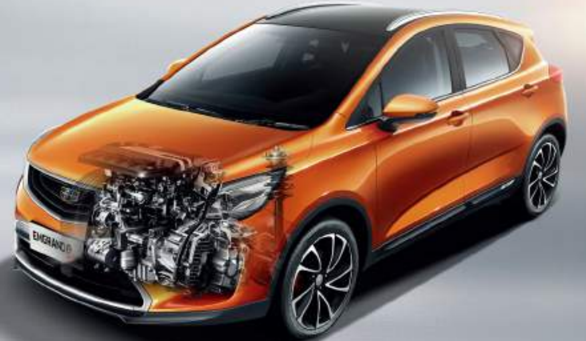
محرك فعّال يجمع بين 1.8 لتر + 6DCT محرك Ily-4G18 المطور من قبل جيلي مع ناقل حركة جاف مزدوج بالتعاون مع الشركة العالمية Getag و LUK لتوفير القوة وسرعة نقل الحركة ودقة التحكم في التشغيل.