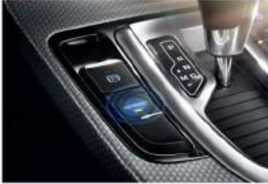
ناقل الحركة Aisin 6DCT هيكل صغير وخفيف، ناقل الحركة فعّال، تشغيل سهل ونشيط يجعل ناقل الحركة Aisin 6DCT الآلي الأفضل في فئتها.