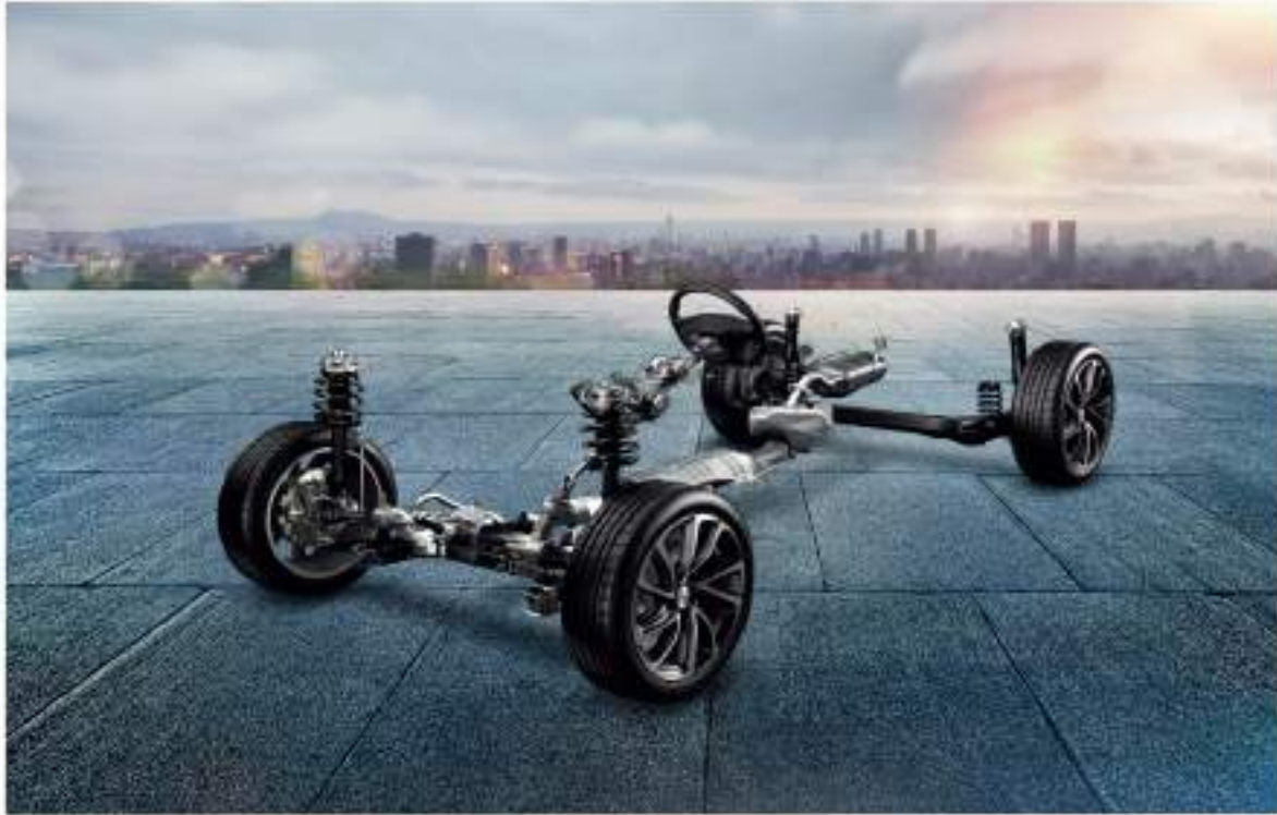
معايرة وضبط الشاسيه بواسطة LeanNova معايرة وضبط الشاسيه بواسطة LeanNova الشركة العالمية المتخصصة في معايرة الزوايا، وسرعة، ومسار الدوران في النطاق الأكثر الراحة ما بين 1 و 2 هرتز لإيصال راحة في المساحة وأداء التشغيل.