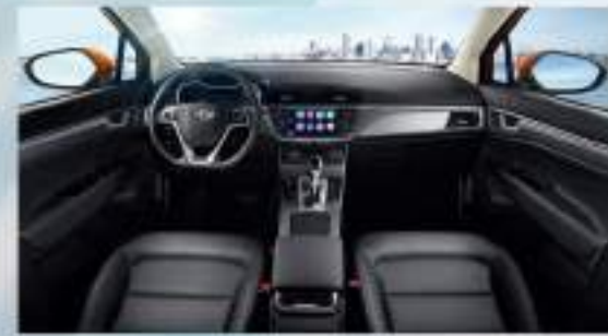
الإيقاع الرياضي مع الفرش الأسود الأنيق يثير الروح الرياضية بداخلك