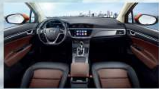
مقصورة فخمة باللونين الأسود والبني تعزز المحيط العالي الجودة

أنابيب العادم المزدوج مرتفعة ومنفصلة مع مصابيح ضباب واضحة